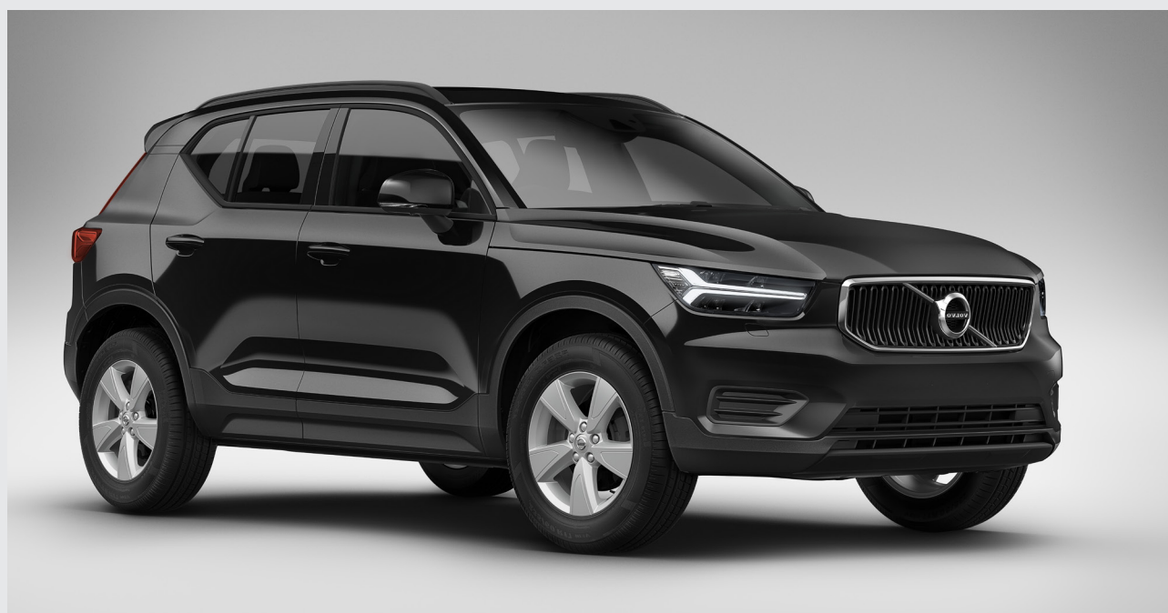
Základná výbava XC40, farba čierna; 17-palcové disky strieborné