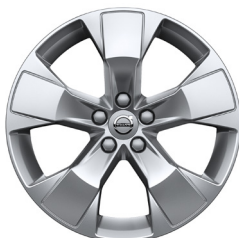
18" Momentum STD (921)