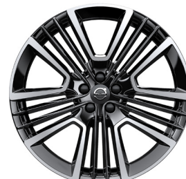
21" príslušenstvo (800141)