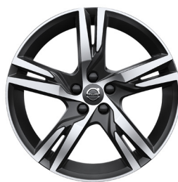
R-design 18" STD / 19" OPT (911)