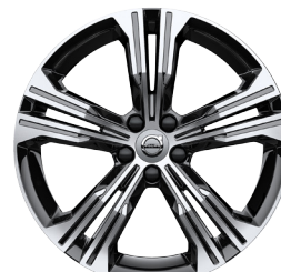
19" Inscription OPT