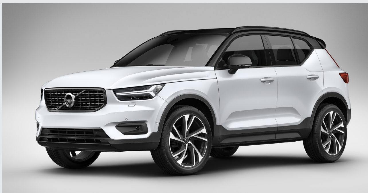
Výbava R-DESIGN, farba Crystal White perleťová; štandardná čierna strecha, voliteľné 20-palcové disky s piatimi dvojitými lúčmi