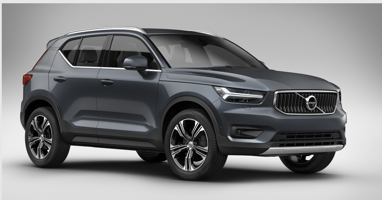
Výbava INSCRIPTION, farba Denim Blue metalická; voliteľné 19-palcové disky s piatimi dvojitémi lúčmi