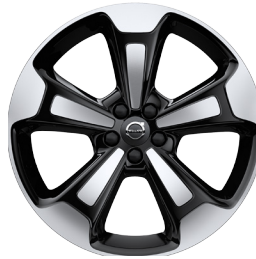
20" Mom./Insc. OPT (917)