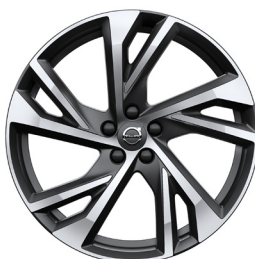
20" R-design OPT (920)