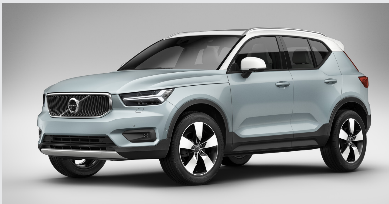
Výbava MOMENTUM, farba Amazon Blue; voliteľná biela kontrastná strecha a spätné zrkadlá, voliteľné 19-palcové disky biele

18-palcové disky z ľahkej zliatiny, 5-lúčové, prevedenie Silver, pneumatiky 235/55 R18