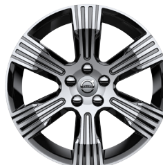
18" Inscription STD