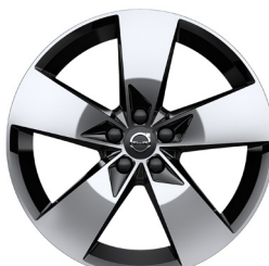
19" Momentum OPT (922)